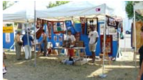
Paradeta d'ADANE a la 3a FestaXÀfrica.

En el marc de l'XIa. edició de l'European Balloon Festival - la concentració internacional de globus aerostàtics més important del nostre país i una de les capdavanteres a nivell europeu- hi hagué estands, activitats, espectacles, música, tallers, etc. de temàtica africana.