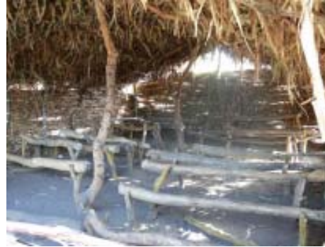
Les escoles txadianes. Vista exterior (a l'esquerra) i vista interior (a la dreta)