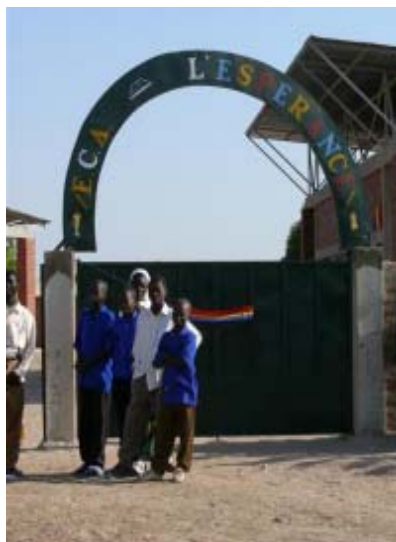
Com recorda el nom de l'escola, els nens i les nenes són el futur i l'esperança del Txad