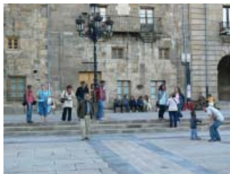
Fent una passejada junts.

maneres de treballar, vam identificar projectes comuns i vam establir noves estratègies de col·laboració conjunta.