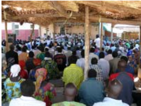
Inauguració institucional del Centre Sociocultural Saint Cyrille.

Conegueren de primera mà les activitats que es duen a terme a les ciutats de Kélo i Laï, i a les localitats de Dono-Manga, Baktchoro i Bayakà, així com l'inici de la construcció del centre sociocultural de la localitat de Dogou.