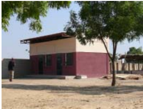
Despatx de la Comissió de la SIDA.