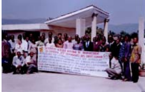
Jornades a Kpalimé (Togo)