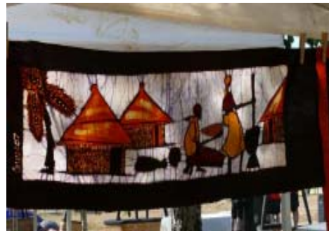
Mostra de batiks.

Durant el mes d'abril farem l'exposició de batiks a l'Hospital del Mar de Barcelona, que no es va poder dur a terme l'any passat. Possiblement, durant aquest any també es farà l'exposició de batiks a l'Hospital de l'Esperança de Barcelona.