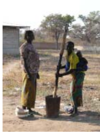
Exterior de l'hospital de Dono-Manga.