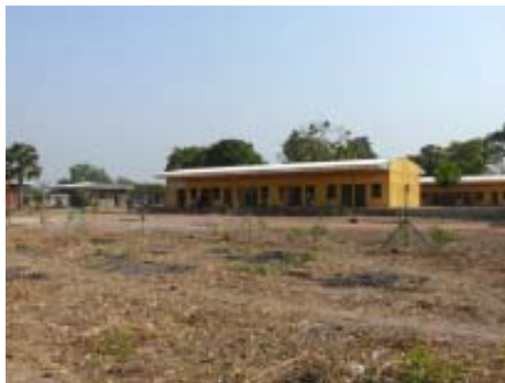
Hospital de la localitat de Dono-Manga.