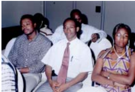
L'Agus a Banjul.

Hi assistiren més de 30 activistes dels drets humans procedents de Togo, Benín, Costa de Marfil, Libèria, Guinea, Mali i Senegal, a més dels ponents i altres participants.