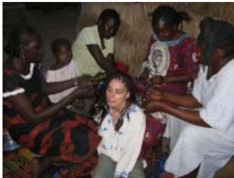
A la «pelu» abans de Nadal