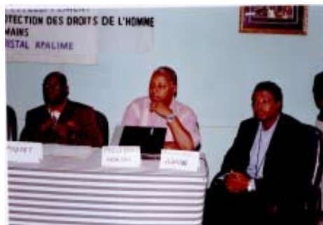
L'Agus a Kpalimé.

La ràdio i la premsa escrita de Togo, com ara Le Canard (09-02-2007), Liberte (12-02-2007) i Golfe Info (14-02-2007), es feren ressò de les jornades.