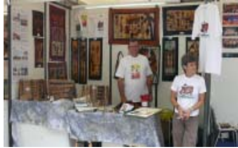
La nostra paradeta de sempre.

informatiu i d'oferta de marxandatge va tenir molt d'èxit i hi vam recaptar 3.427,30€.