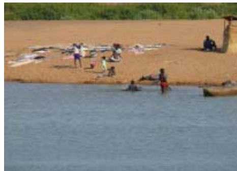
Riu Logone, a Lai