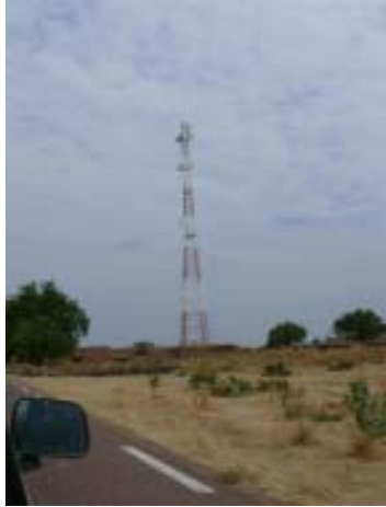
Antenes de telefonia mòbil al costat de cabanes de fang i palla.