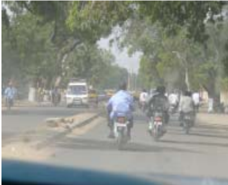
N'Djamena, capital de Txad