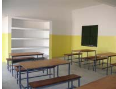
Aula de formació i de jocs.