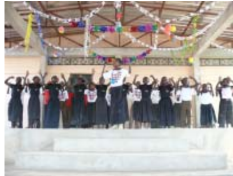
Continuació de la festa de Inauguració del Centre Sociocultural.