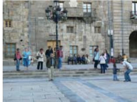
Dando un paseo juntos.

Fue un encuentro gratificante durante el cual pusimos en común nuestras maneras de trabajar, identificamos proyectos comunes y establecimos nuevas estrategias de colaboración conjunta.