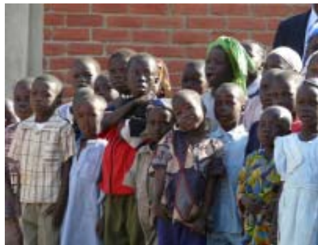
Grupo de alumnos de la escuela.