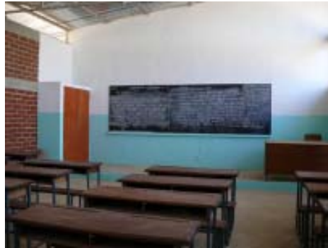
Interior de una aula de la escuela.

La escuela de primaria consta de 7 aulas de clase que abarcan desde pre-CP (parvulario 5 años) hasta CM2 (6ª clase, final de los estudios primarios). Cada aula tiene 25 pupitres de dos plazas y se ha dotado al centro con material didáctico y pedagógico para alumnos y profesorado. Además, se ha construido un pabellón administrativo que consta de dirección, sala de profesores y secretaría, y 6 letrinas (3 para niños y 3 para niñas). El centro está dotado de instalación eléctrica solar y tiene un pozo y un depósito de reserva de agua.