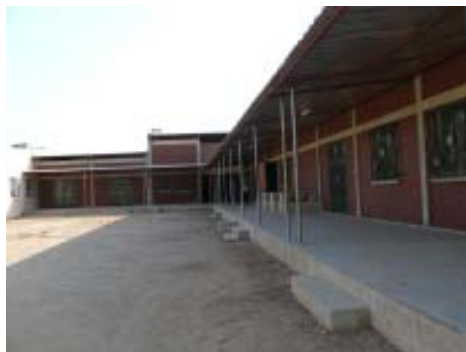
Exterior del Centro Sociocultural de Saint Cyrille.

-de un campo de deporte para favorecer la