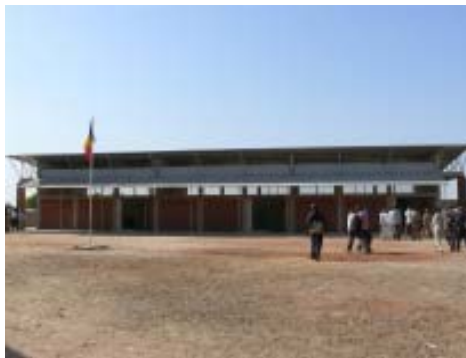
Exterior de las aulas de la escuela L'Espérance