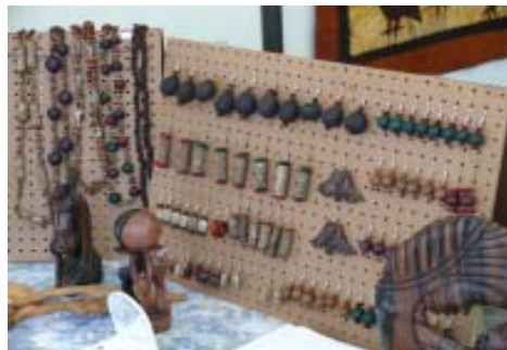
Muestra de artesanía

Este año en nuestro stand de la Mercè hemos tenido una muestra de productos artesanales de Mozambiques, Togo y, por primera vez, del Chad.