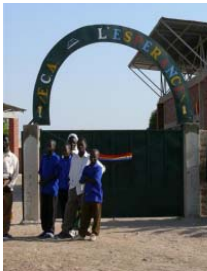
Como recuerda el nombre de la escuela, los niños y las niñas son el futuro y la esperanza de Chad