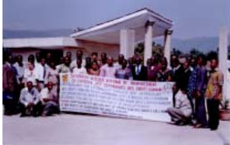
Jornadas en Kpalimé (Togo)

La radio y la prensa escrita de Togo, como Le Canard (09-02-2007), Liberte (12-02-2007) y Golfe Info (14-02-2007), se hicieron eco de las jornadas.