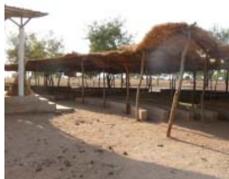
Anfiteatro del Centro Sociocultural de Dogou.