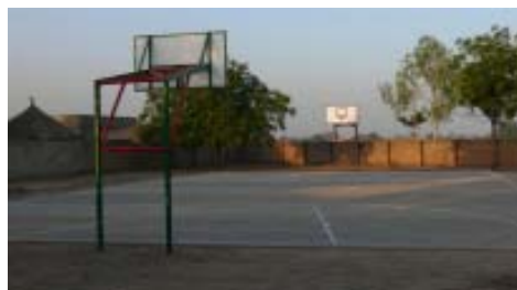
Campo de deportes.

dad Internacional del País Vasco y los Ayuntamientos de Reinos, Camargo, Castrourdiales y Medio Cudeyo, a través de Adane-Cantabria.