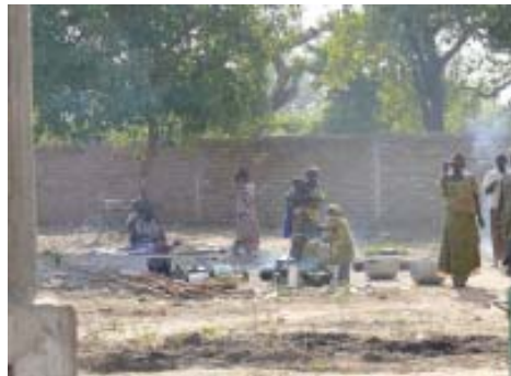
Exterior del hospital de Dono-Manga