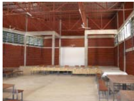
Interior de la sala polivalente.