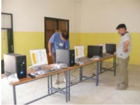
Montaje de los cuatro ordenadores de la sala de informática.