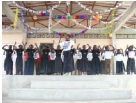
Continuación de la fiesta de Inauguración.