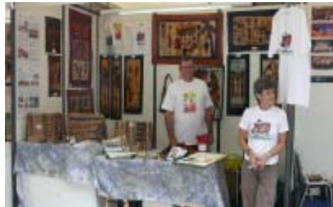
Nuestra paradita de siempre