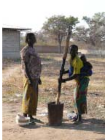
Exterior del hospital de Dono-Manga