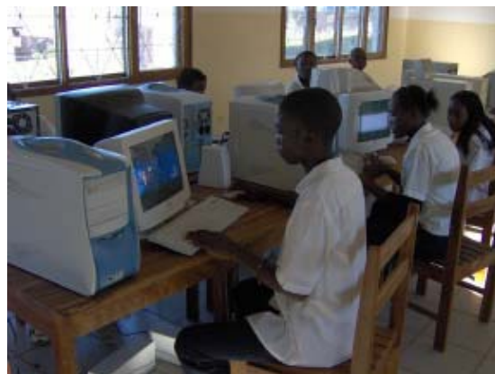
Els primers estudiants