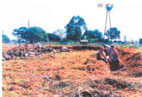
Treball de voluntaris i voluntàries a l'inici de les obres de l'escola

Albacine és un altre barri perifèric de la ciutat de Maputo, proper a Mahotas i a Magoanine. Entre els anys 2000 i 2002 hi vam construir vuit aules, la sala de mestres, la direcció, la secretaria i un pou d'aigua amb l'antic molí de vent de l'escola d'As Mahotas –que ja estava dotada d'electricitat– per extreure-la.