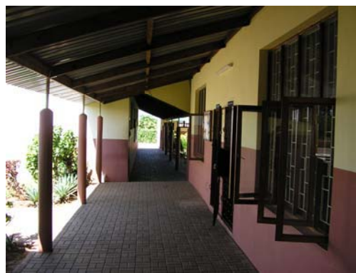
Imatges de les instal·lacions de l'Escola de Secundària de Magoanine construïda entre els anys 2001 i 2004