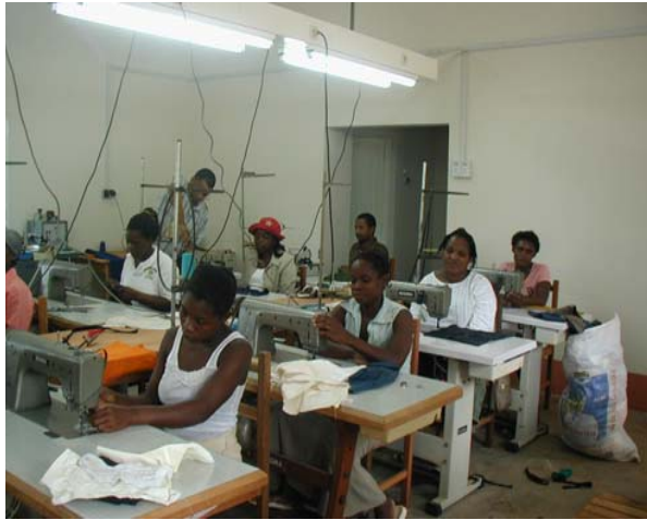
Aprenent a cosir amb les màquines