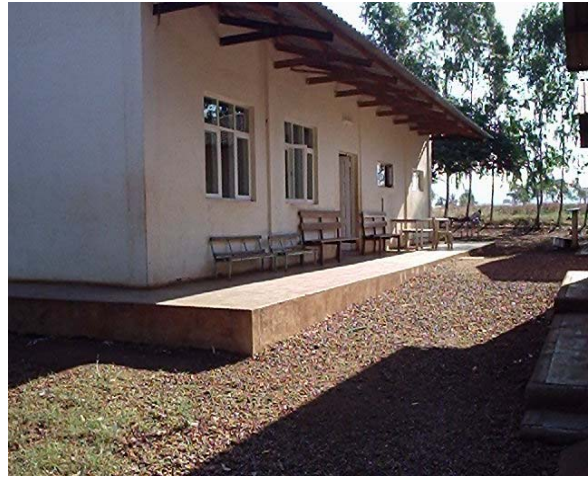
La sala de costura de Changanane