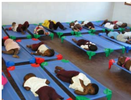
Nens i nenes de l'Escolinha fent la migdiada a les hamaques.