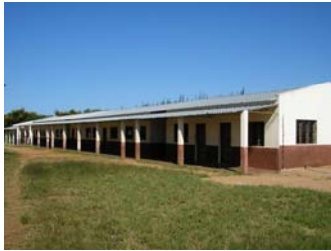
L'escola d'Albacine en l'actualitat

. Cost total del projecte .....35.250,00 € . Subvenció de l'ACCD .....30.000,00 €