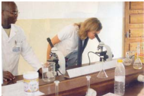
En el laboratori de l'escola de secundària

goanine, on va visitar l'escola de Secundària i les seves instal·lacions, entre elles el laboratori. Durant la visita, la Infanta va plantar un arbre, com és tradició entre els visitants.