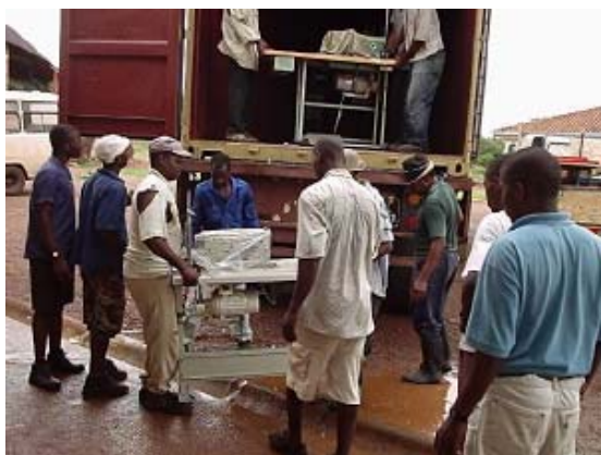
Descàrrega de les màquines de cosir.

Va ser recollit, buidat i distribuït entre els diferents projectes als quals anava dirigit: les sales de costura de Massaca i Changanane, l'Escolinha de l'Escola Comunitària d'Hitakula a Mahotas i l'Escola de Secundària de Magoanine.